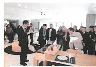
造形大卒業・修了研究展見学会