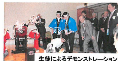
生徒によるデモンストレーション