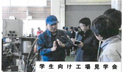
学生向け工場見学会