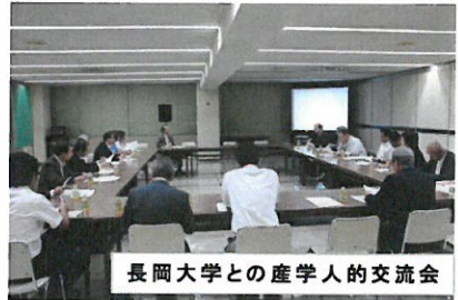
長岡大学との産学人的交流会