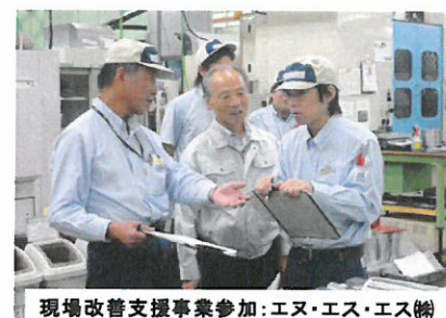
現場改善支援事業参加:エヌ・エス・エス(株)