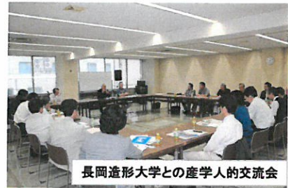
長岡造形大学との産学人的交流会