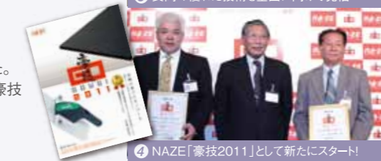
4 NAZE「豪技2011」として新たにスタート!