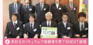
4 多彩なカリキュラムで後継者を育てるNEXT道場