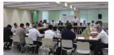
1 2011年度も活動重点テーマ「環境対策事業」

○NEXT道場を卒業した世代(50歳未満)を対象に、「長岡の企業・従業員の活性化」をメインテーマに全5回実施。講師による講演内容を踏まえた活発な意見交換を行った。