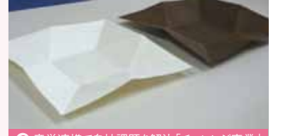
2 産学連携で自社課題を解決「チャレンジ事業」