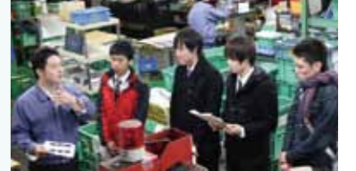
2 見学会で学生へ長岡のモノづくりをアピール!