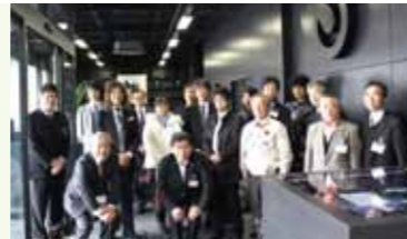
1 2011年度は、プレミアムビジネス関連の見学も実施

○新入会員及び近年に入会した4会員が、自社の紹介や取り組みについて積極的にPR。会員間の新たな連携が生まれた。プレミアムビジネス講演会も併せて開催。