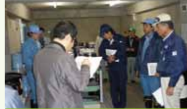
2 5Sチェック会で製造現場の改善を支援