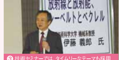
3 技術セミナーでは、タイムリーなテーマも採用