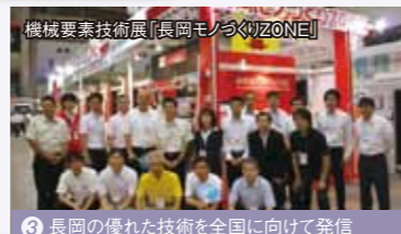
3 長岡の優れた技術を全国に向けて発信