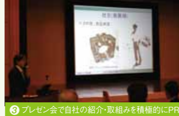
3 プレゼン会で自社の紹介・取組を積極的にPR