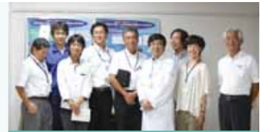
1 産学人的交流会で大学・高専がより身近に

○産学連携の仕組みを用いて各社の抱える課題に対して解決・提案を行った。 2011年度は、長岡造形大学生によるNAZEポスターデザインの作成と、長岡大学との連携による会員企業ホームページ支援事業(広報部会担当)を実施。 NAZEポスターは、2種を作成。自社ホームページの改善を希望する4社には、コンテンツ診断、システム診断を実施し改善提案を報告した。成果については、NAZEの総会で学生が成果発表を行った。