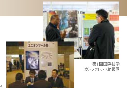
第1回国際技術学カンファレンスin長岡