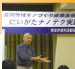
にいがたナノテク実践研究会を運営